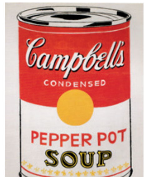
Andy Warhol, Campbell's Soup Can (Pepper Pot), 1962, caseïne en potlood op linnen doek, 50,8 x 40,6cm, privécollectie