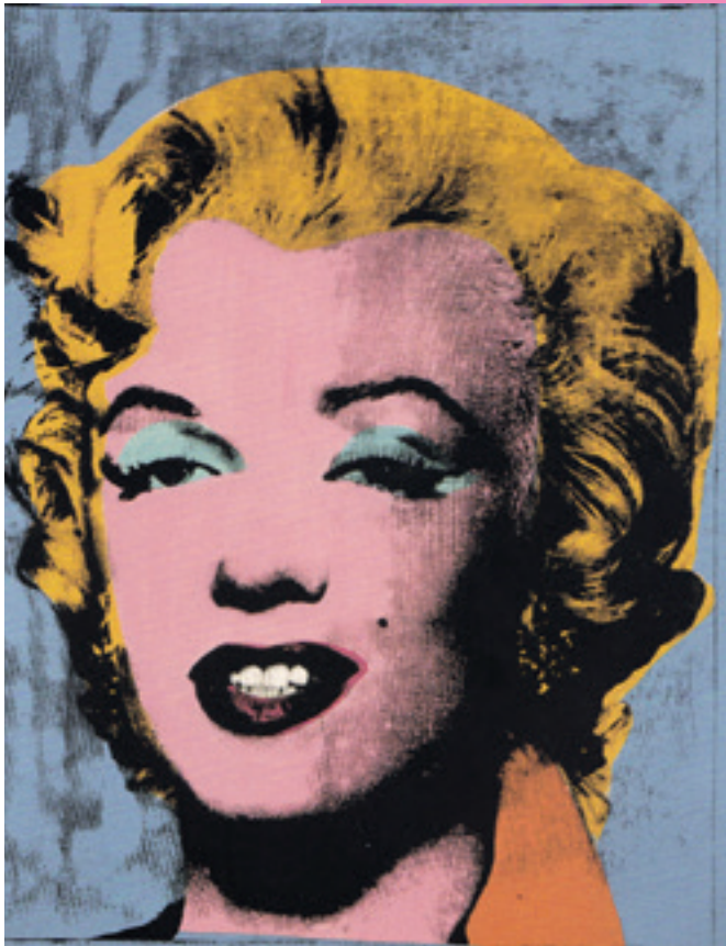
Andy Warhol, Blue Marilyn, 1962, acryl en zeefdrukinkt op linnen doek, 50,8 x 40,6 cm, Princeton University Art Museum