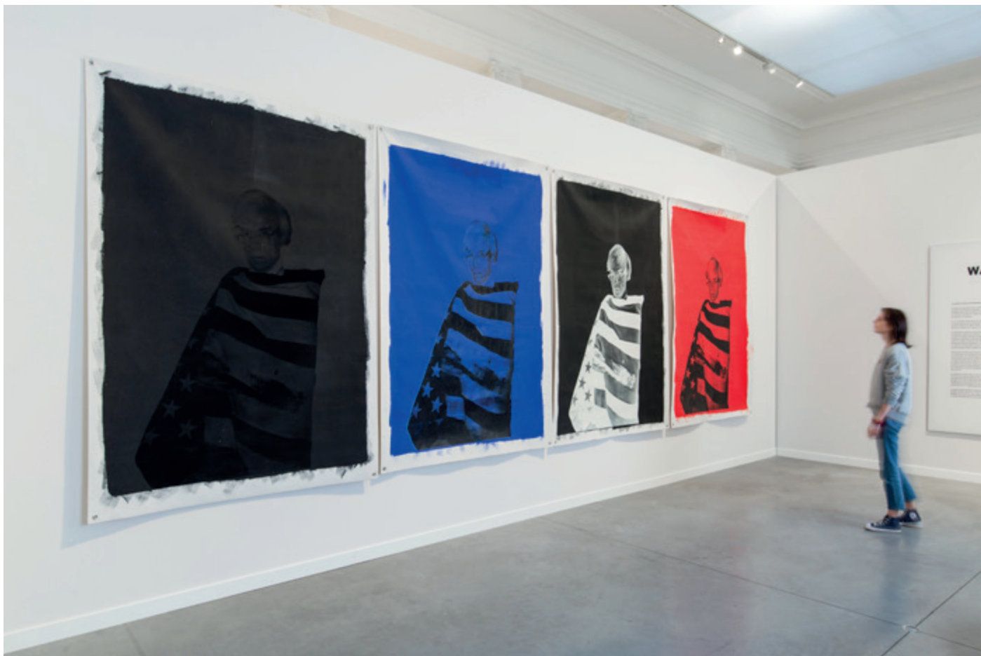
Christopher Makos, Andy in American Flag, 1982, acrylique et sérigraphie sur toile © Christopher Makos © Tempora © Denis Decaluwé